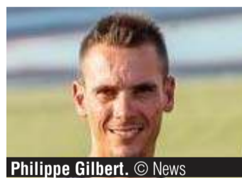
Philippe Gilbert.